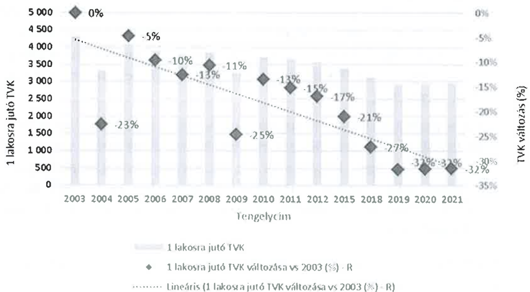
1 lakosra jutó TVK és változása a 2003 bázisévhez képest (%)

A fenti két tényező kölcsönhatásának eredményeként jelentősen csökkent az egy lakosra jutó TVK, vagyis a járóbeteg ellátó kapacitás. A 2003-as bázisévhez képest a 2021-es 1 lakosra jutó TVK 32%-al alacsonyabb, ami leginkább az előjegyzési idők (várólisták) meghosszabbodásában nyilvánul meg és a lakosság számára már egyértelműen érzékelhető romlást hoz a járóbeteg ellátásban. Az egy lakosra jutó TVK változását az alábbi grafikon mutatja.